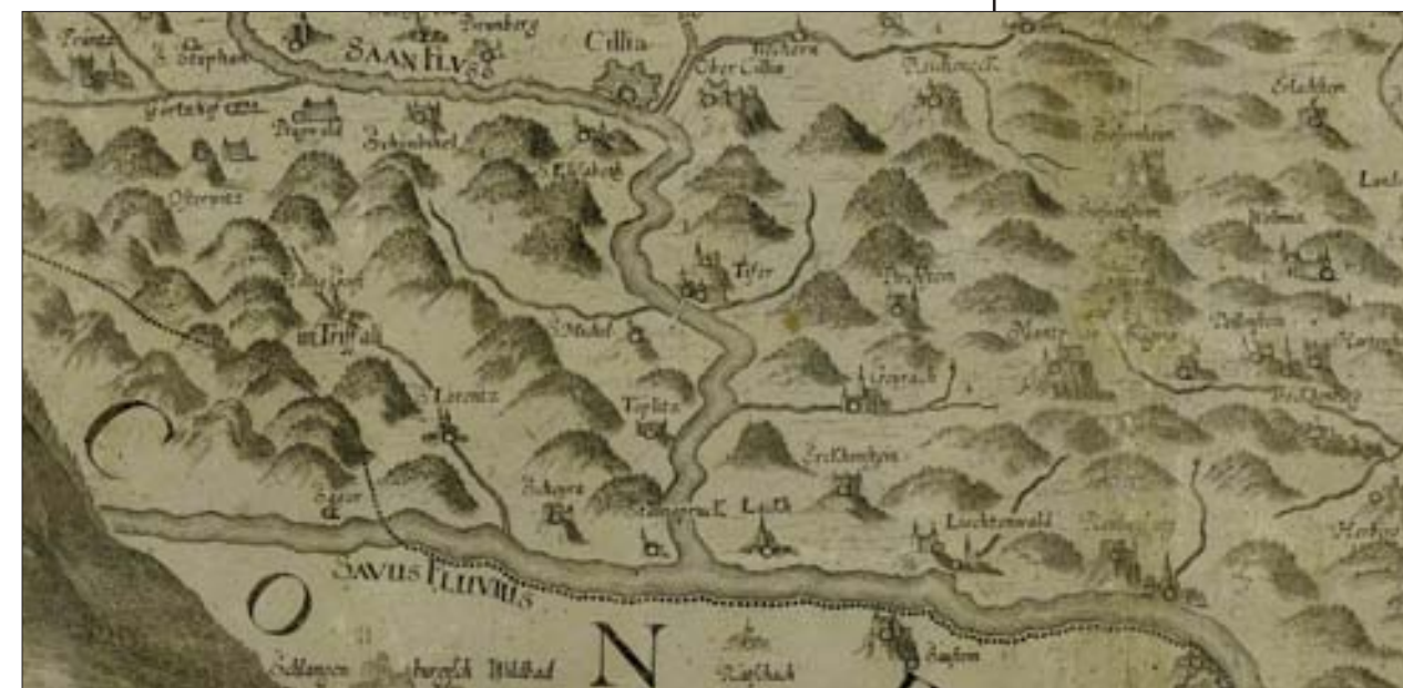
[1678]Styriae Ducatus Fertilissimi Nova Geographica Descriptio

Po podatkih babenberškega urbarja iz leta 1227 lahko sklepamo, da so se podložniki laškega okraja intenzivno ukvarjali s svinjerejo, ovčjerejo, čebelarstvom, zlasti pa s pridelovanjem pšenice, ovsu in boba. 14